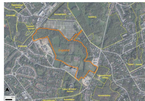
Figure 1-1 - Situation de la station II11 Engeland