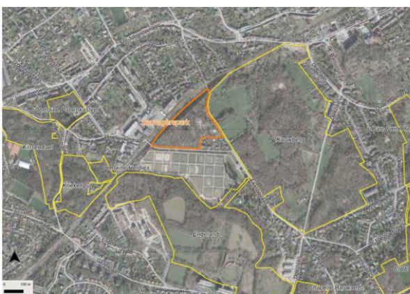
Figure 1-1 - Situation de la station II14 Parc de la Sauvagère et des stations voisines de la ZSC II